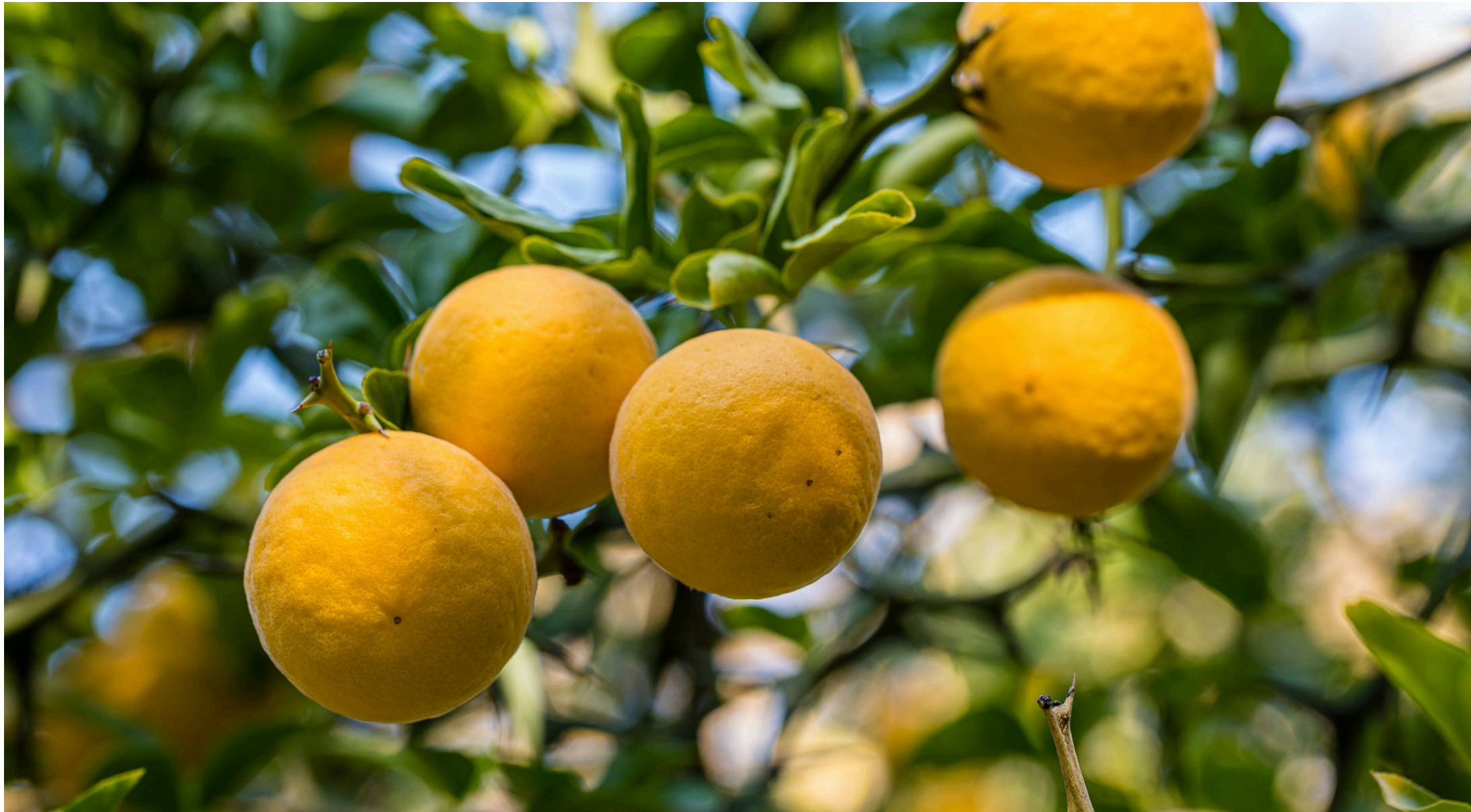
5 | Orangenäste mit Stacheln | Bildquelle: iStockphoto.com, JOSE LUIS VEGA GARCIA