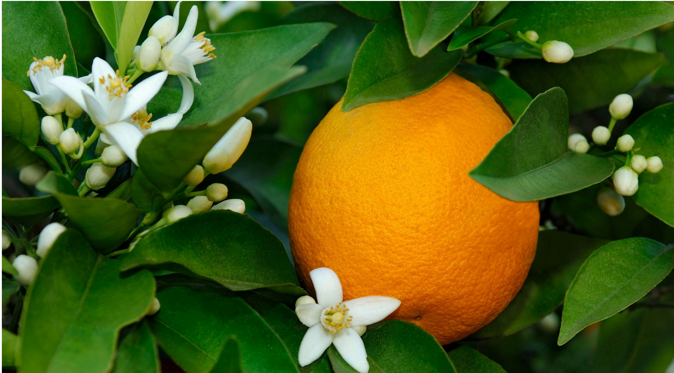
4 | Blüten und Orange am Baum | Bildquelle: istockfoto.com, richterfoto