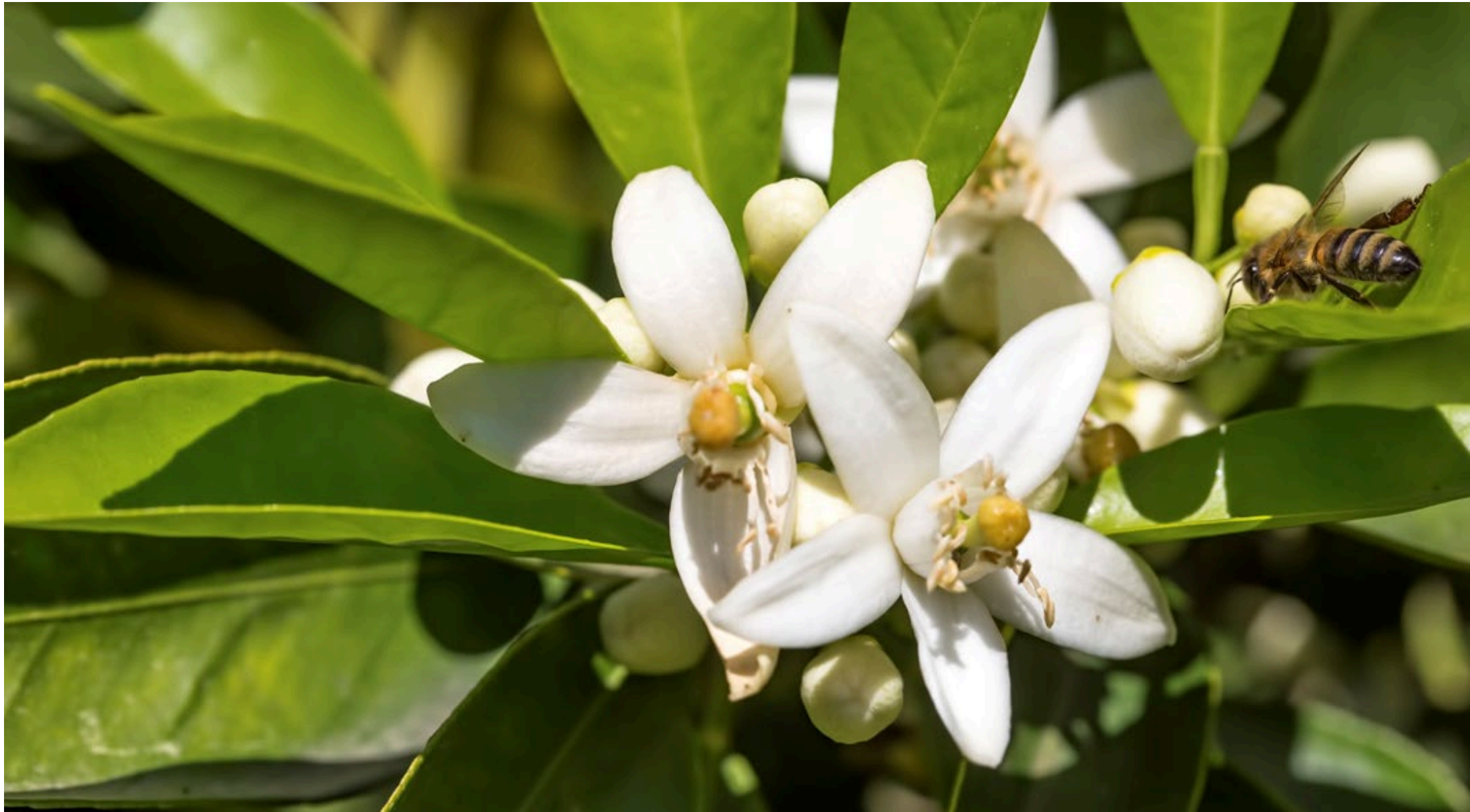
3 | Orangenblüte mit Biene