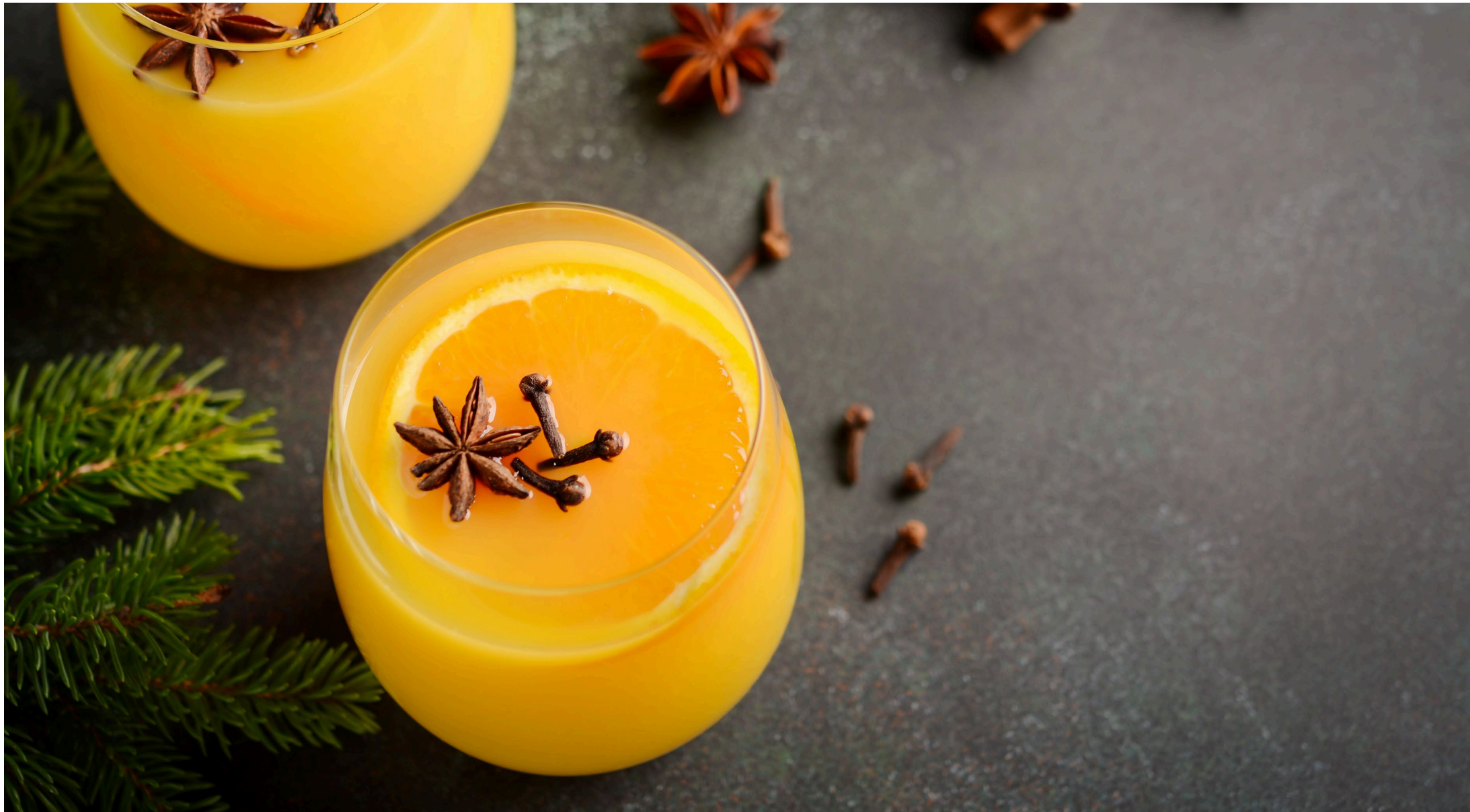
12 | Orangenpunsch