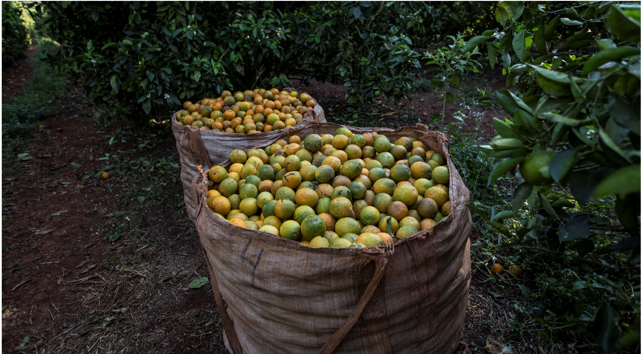
8 | Orangenernte