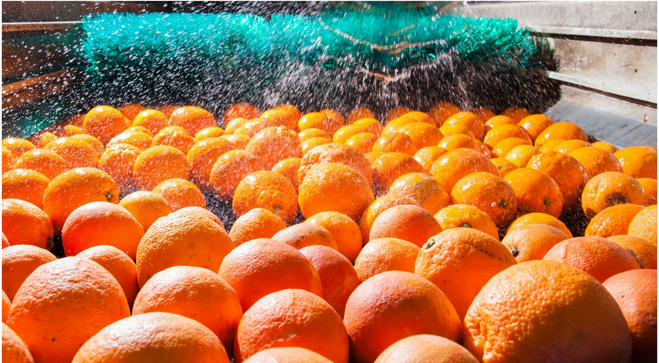
9 | Orangenwaschstraße