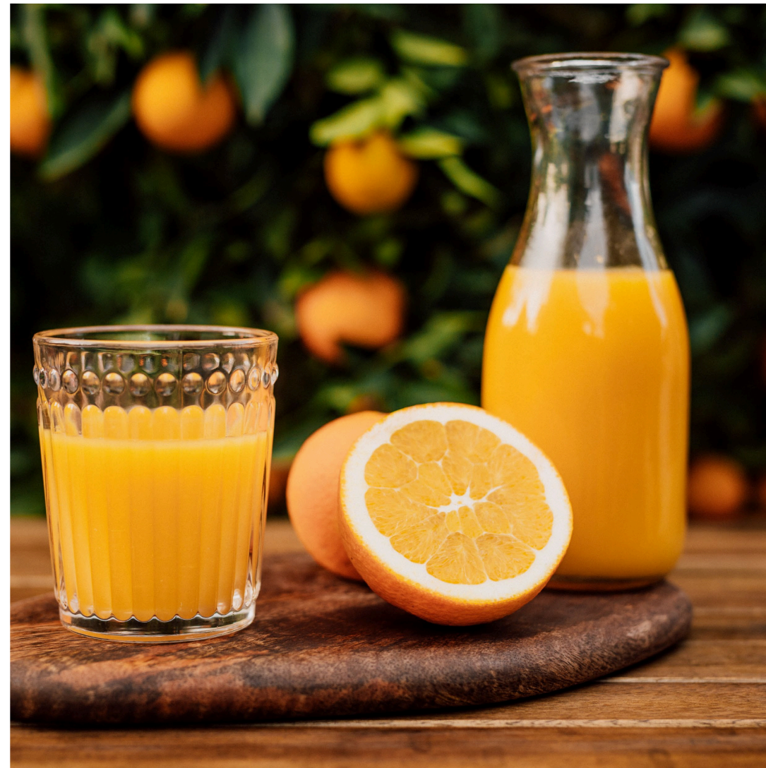
11 | Orangensaft| Bildquelle: iStockphoto.com, DanaHirsch