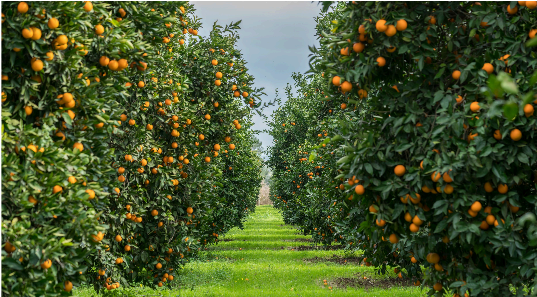
2 | Orangenbäume auf einer Plantage