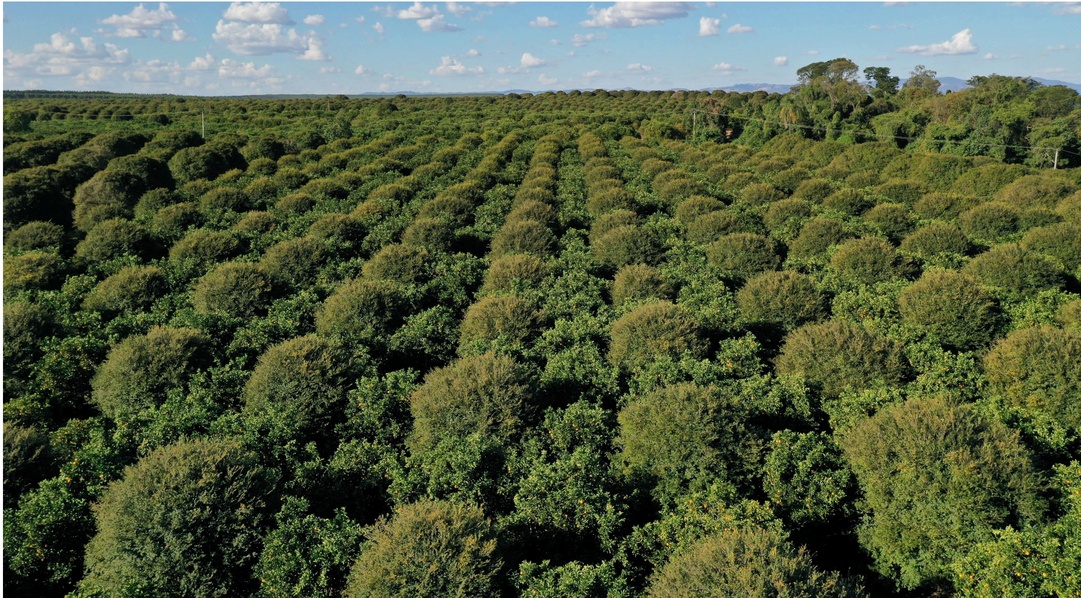
1 | Orangenplantage in Sao Paulo in Brasilien